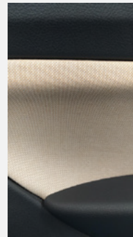
Material sostenible procedente del bambú

desde el punto de vista ecológico, la planta de bambú presenta un impacto positivo ya que crece y se reproduce a gran velocidad, y no necesita abonos, ni cuidados especiales o pesticidas. además, no requiere grandes cantidades de agua ni impacta en el ciclo alimenticio de los animales puesto que la variedad de bambú usada no es consumida por éstos.